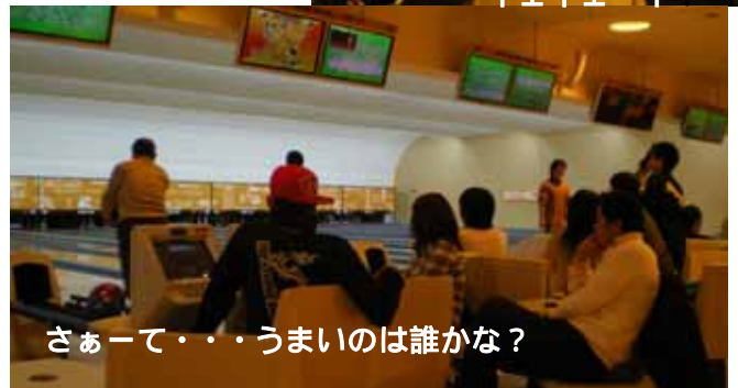
さぁーて・・・うまいのは誰かな?