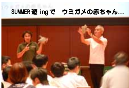
SUMMER 遊 ing で ウミガメの赤ちゃん...

まず本番に先立ち、7/9から開講式・事前指導が始まりました。今夏は、2年建築科1名と昨年から継続の3年機械電気科・建築科各1名の計3名が参加しました。行き先は、運送会社や県立図書館などです。昨年に続いて2年目の経験者も、昨年と異なる場所での体験で一生懸命頑張りました。県立図書館では「SUMMER 遊 ing」のイベントの会場準備や受付業務のお手伝いなど、生徒たちは一生懸命頑張りました。